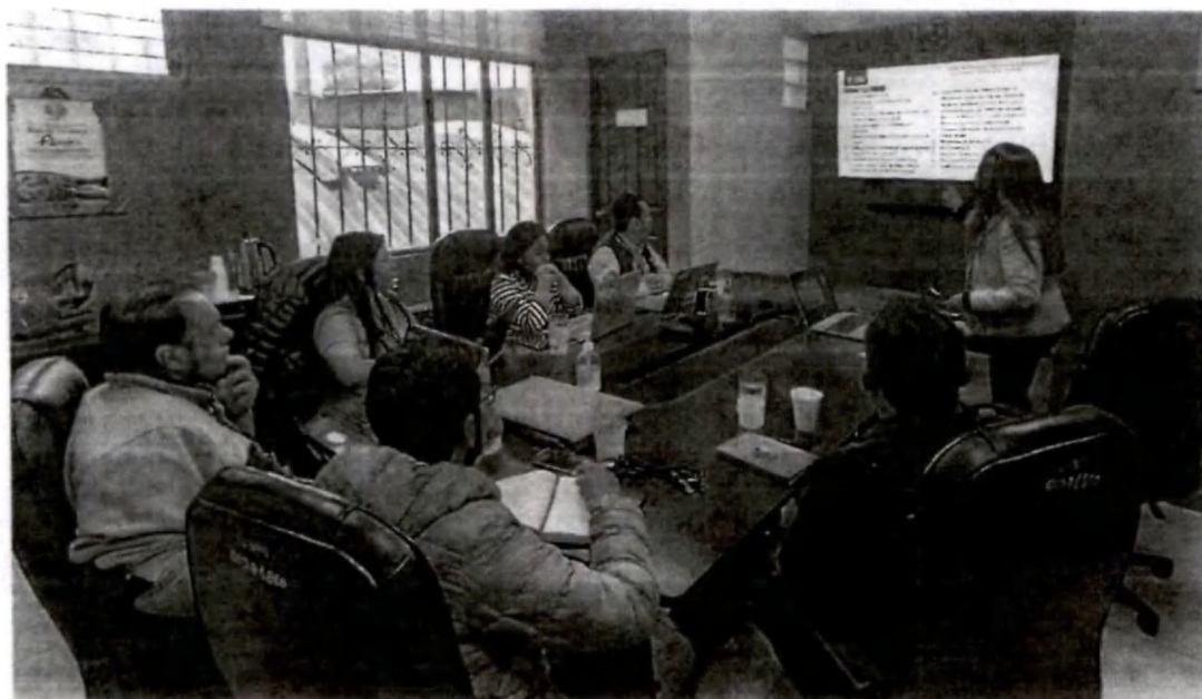
Figura 2. Asociación FECCEG en la inducción sobre la Ley de Contrataciones, uso de Guatecompras y elaboración de informes mensuales.