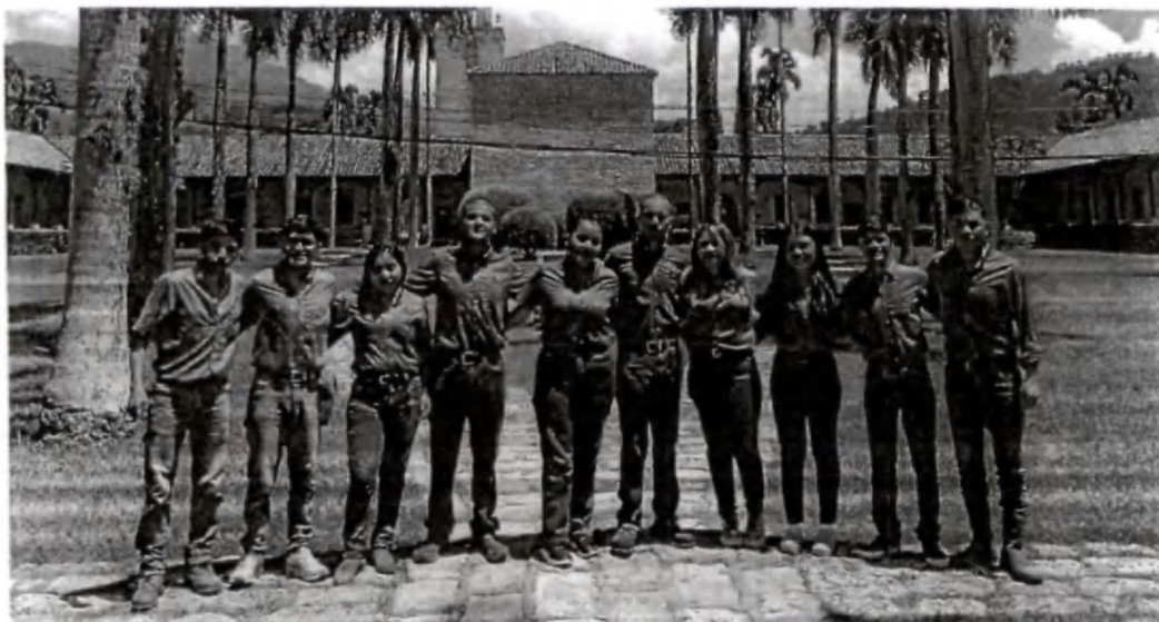
Figura 3. Estudiantes beneficiados por la Asociación AGROBECA en la Escuela Agrícola Panamericana Zamorano.